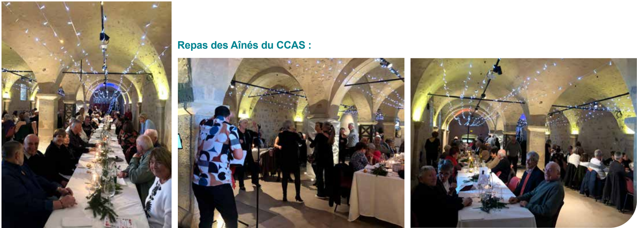
Repas des Aînés du CCAS :

humeur et pour avoir pleinement joué le jeu de ce premier rendez-vous festif. Ce succès collectif est une véritable satisfaction et nous encourage à envisager de prochaines éditions. Nous tenons aussi à remercier les pompiers, la gendarmerie, la mairie, et très chaleureusement les services techniques pour leur accompagnement, leur soutien et leur disponibilité, indispensables à la bonne mise en place et à l'organisation de ce marché de Noël. Encore merci à toutes et à tous pour avoir fait de ce premier marché de Noël une vraie réussite ! Le Comité des Fêtes et les bénévoles